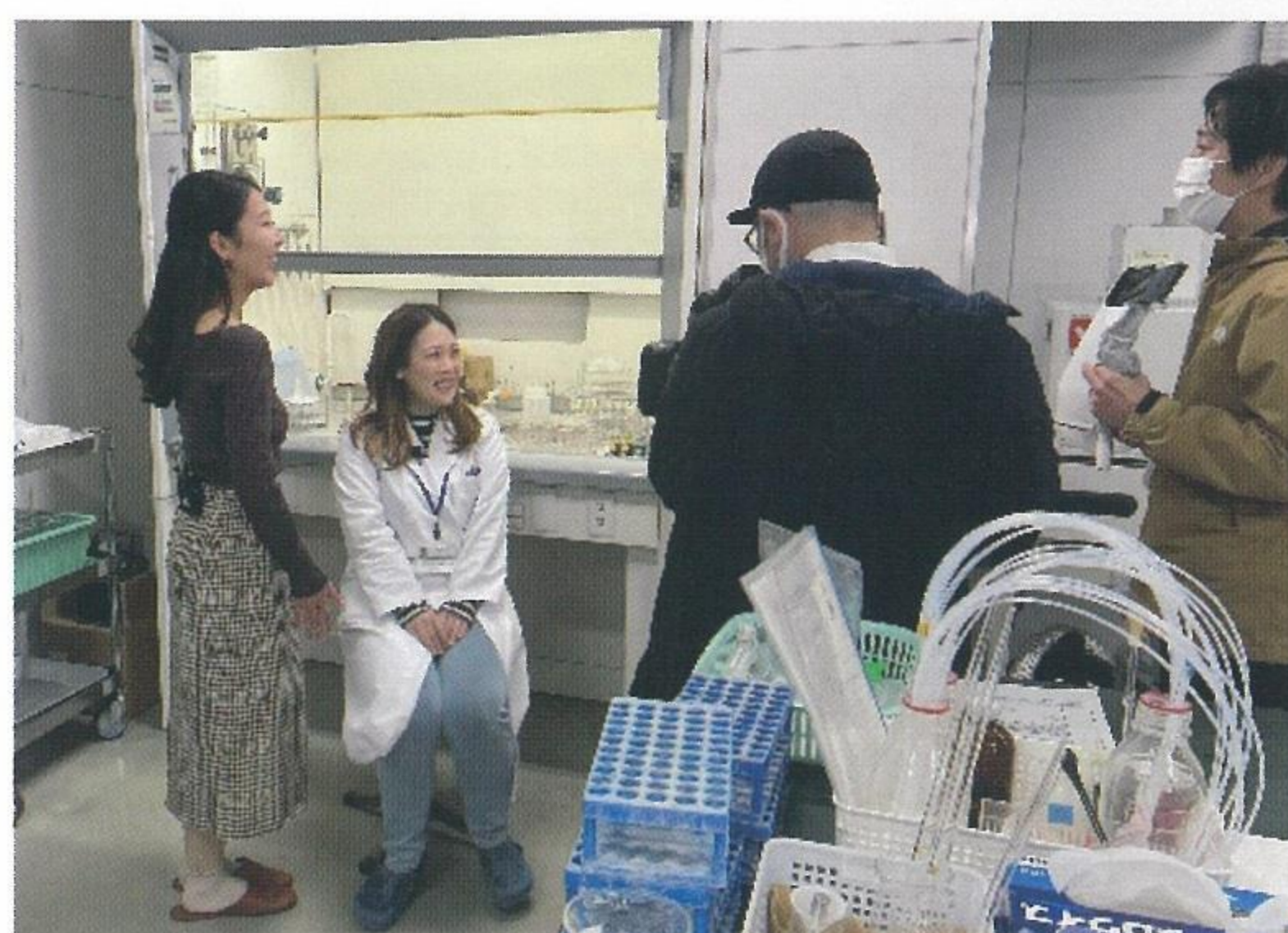
働きがいについてのインタビュー