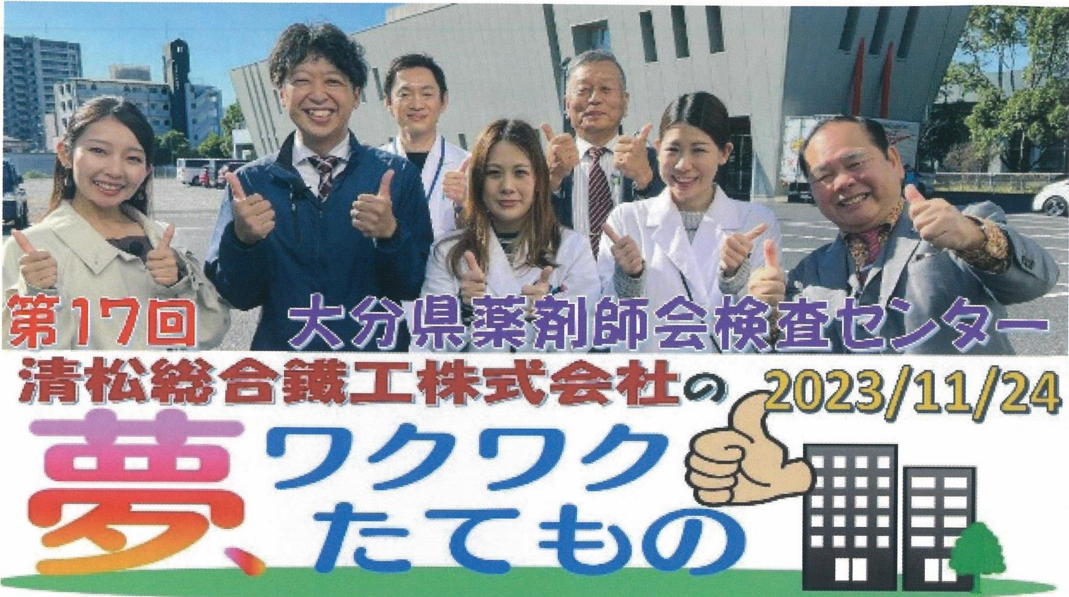
▲番組恒例の「いいね！」のポーズ（清松社長さんも一緒に）